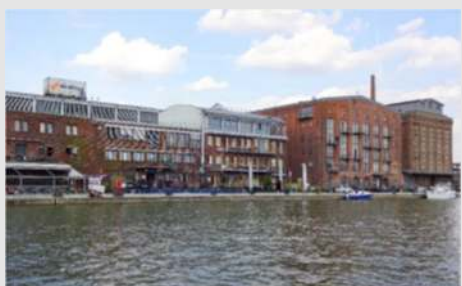
Krimitor - Führung zu den Filmschauplätzen von Wilsberg und Tatort