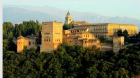
Gibraltar (Rock-Tour, Affenreservat) - Granada (Alhambra, Albayzin)