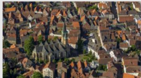
Mittagessen in Telgte - Landgestüt Warendorf