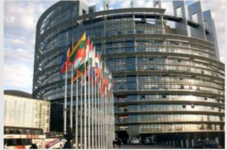
Straßburg zur Weihnachtszeit - Besuch des EU-Parlaments