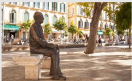
Sevilla (Altstadt, Santa Maria del Sede) - Malaga und Picasso