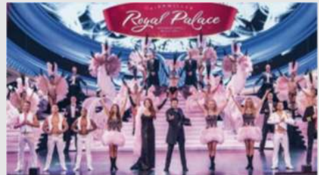
Bootsfahrt auf der Ill - Dîner Spectacle in Kirwiller