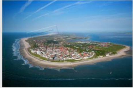
Stadtbesichtigung in Meppen - Norddeich und Insel Norderney