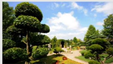
Oldenburg - Bad Zwischenahn (Park der Gärten, Molly-Bahn)