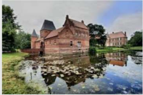
Iglo-Werksbesichtigung - Burg Hülshoff