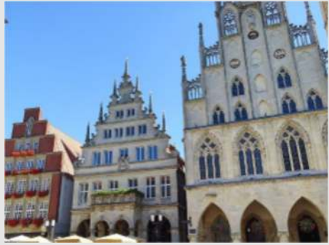
Stadtrundfahrt und -besichtigung Münster mit Friedenssaal