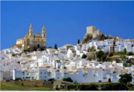
Bergdorf Mijas - Malaga (Gibalfaro Burg, Kathedrale)