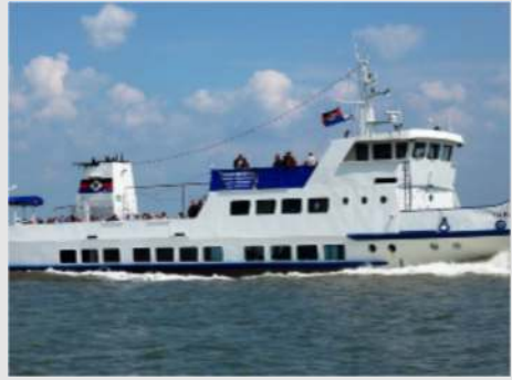
Schloss Jever - Rundfahrt in Wilhelmshaven mit der MS Harle Kurier