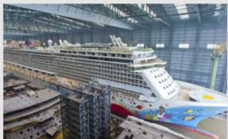
Bremen mit Rathaus, Lloyd-Cafee-Rösterei - Meyer-Werft, Papenburg