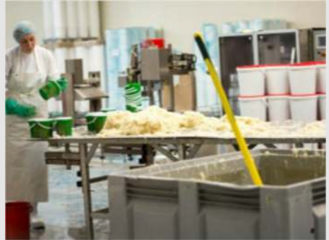
Besichtigung einer Sauerkrautfabrik