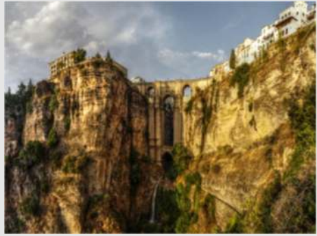
Marbella (Altstadt, Puerto Banos) - Ronda (Areales, San Pedro)